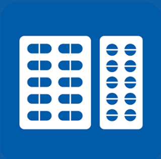
ምልክቶቹን እንዲያስታግስልዎ ፓራሲታሞል ይውሰዱ።

ምልክቶቹ እንደታዩ የኮቪድ ቫይረስ ምርመራ እንዲደረግልዎ ጥያቄ ያቅርቡ (በመጀመሪያዎቹ 5 ቀናት ምርመራው ሊደረግልዎ ይገባል)። https://www.nhs.uk/ask-for-a-coronavirus-test አድራሻዎን እና የሚሰራ ስልክ ቁጥርዎን በመስጠት የምርመራ ውጤትዎ በጽሁፍ መልዕክት እንዲደርስዎ ያድርጉ።