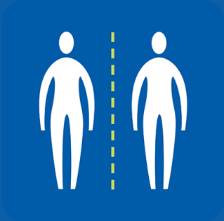
ከሰዎች ጋር ቅርብ ንክኪን ያስወግዱ።