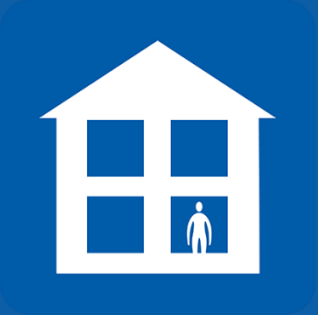
ወደ ሥራ፣ ትምህርት ቤት፣ የጠቅላላ ህክምና ቀዶ ጥገና፣ ፋርማሲ ወይም ሆስፒታል አይሂዱ።