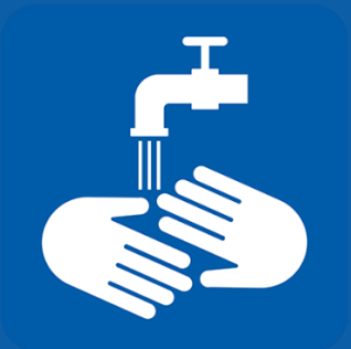
እጅዎን በየጊዜው ይታጠቡ።