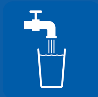
ብዙ ውሃ ይጠጡ።