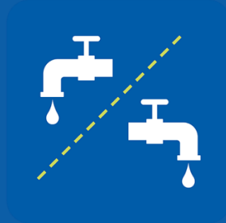
የተለያዩ መገልገያዎችን ይጠቀሙ፤ ወይም ከተጠቀሙ በኋላ ያጽዱ።