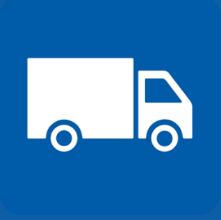
ምግብ እና መድኃኒት እርስዎ ያሉበት ቦታ ድረስ እንዲመጣልዎ ያድርጉ።