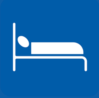
ከተቻለ ለብቻዎ ይተኙ።